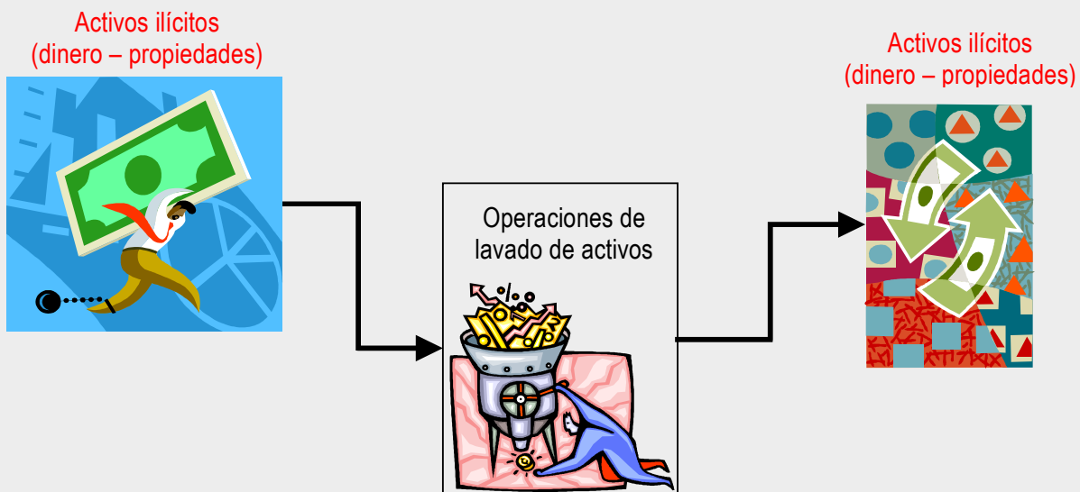
Gráfico 1: concepto de lavado de activos

Ahora bien, cuando una persona o una empresa hace parte de operaciones de lavado SIEMPRE hay riesgo de ser detectado y capturado. Recuerde que a los "lavadores" no les importa perder dinero pues es un costo que hace parte del negocio.